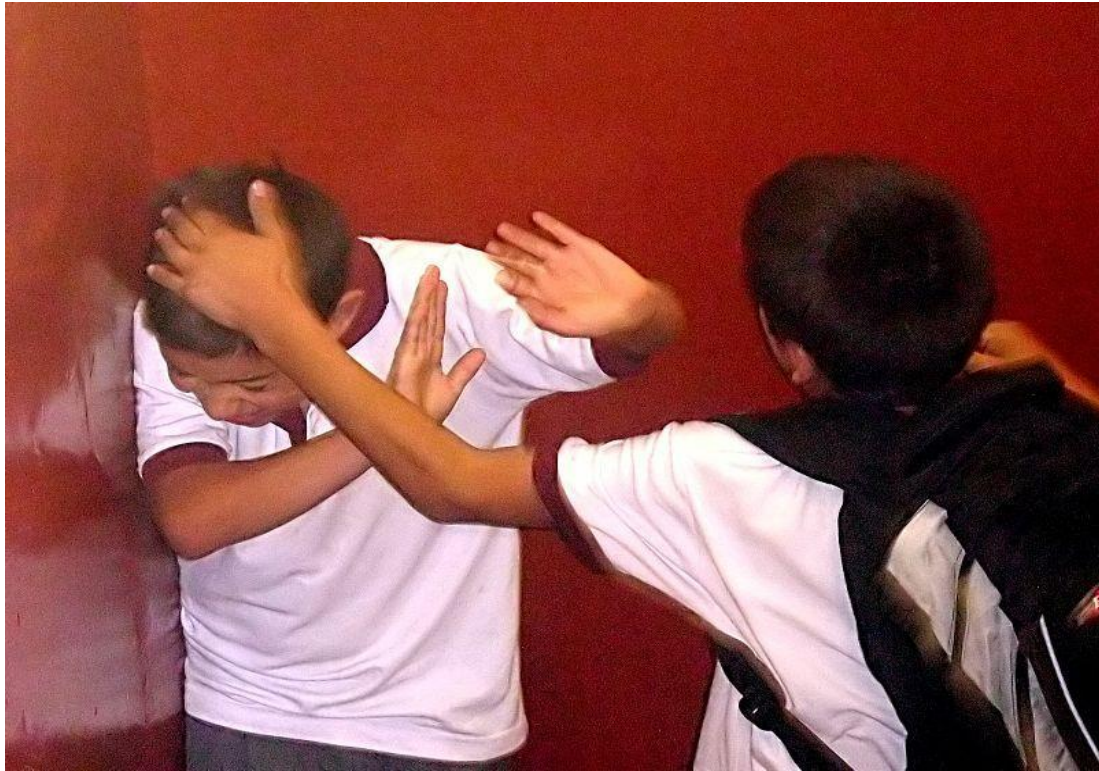
霸凌事件在韓國層出不窮。